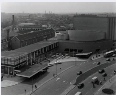
RAT collectie nr. 1237_013_068_001

Je bent aangekomen bij Schouburg Concertzaal Tilburg. Een nieuwe oude naam is weer terug. Het huidige gebouw is 60 jaar geleden neergezet. Vele voorstellingen, concerten en artiesten treden jaarlijks op in het Rijksmonument dat sinds 2015 van nationaal belang is.