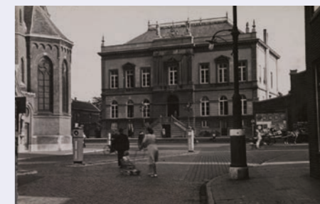
RAT collectie nr. 010580

De laatste stappen lopen via Stadhuisstraat, Stadhuisplein en terug naar Factorium.